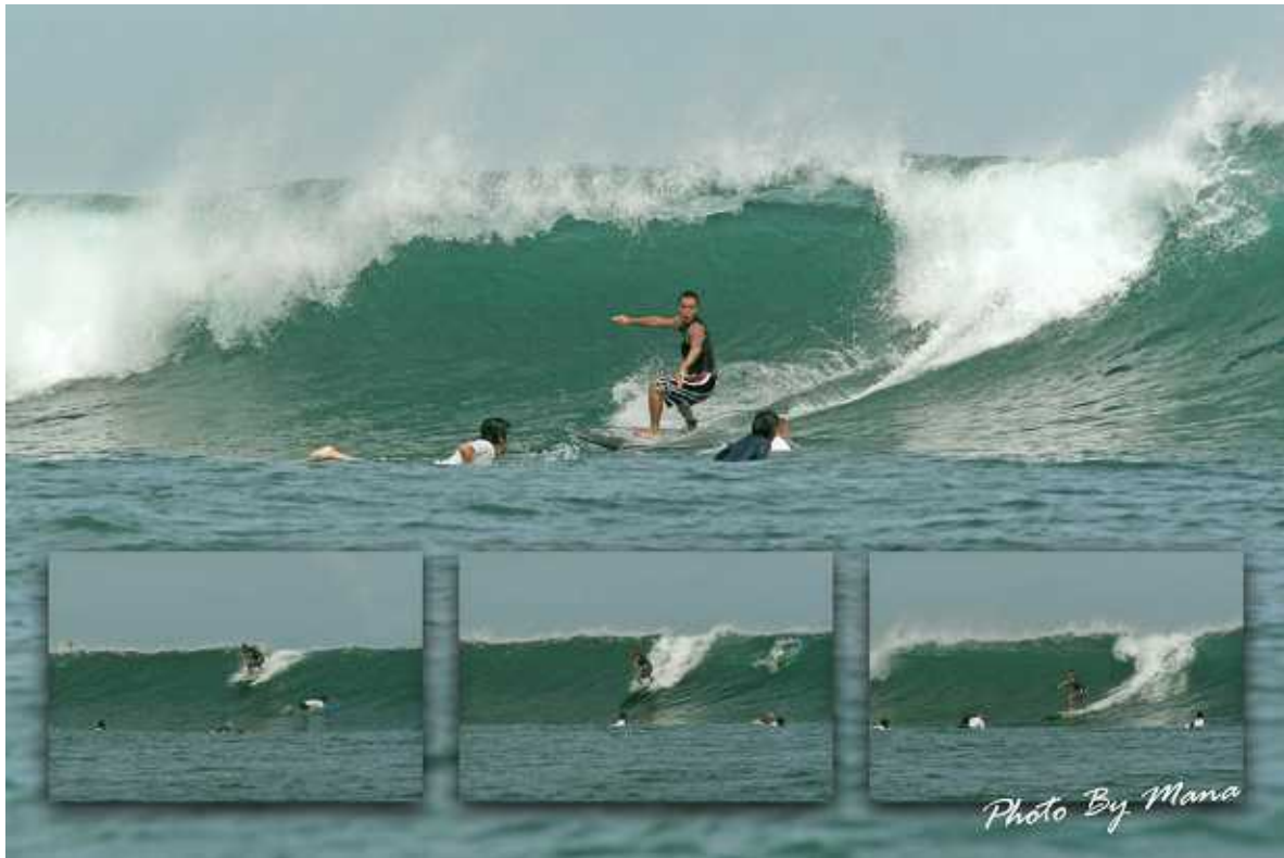
写真：BALI エアポートレフト

始めたのは 18 歳の時、初めての海は北海道函館郊外の榎法華である。当時はシングルフィンのショートボードだった。