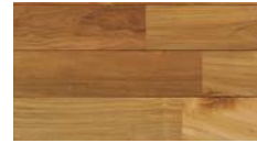
[ クリア ] TK-59MYC-7