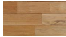
[ 無塗装 ] TKN-59MY-7