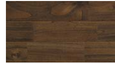
[ ブラック ] TK-59MYB-7