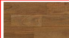
[ アンティーク ] TK-59MYA-7