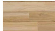
[ ホワイト ] TK-59MYW-7